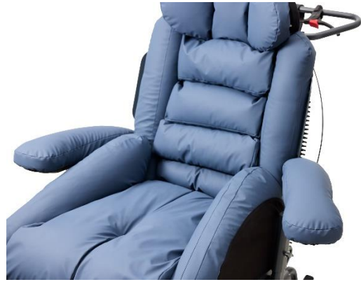
Svingbare armlæn er standard på alle udgaver af Kamille Komfortkørestol.

Der kan tilkøbes krammearme med tyngde, som understøtter borgers arme og bidrager til yderligere tryghed, ro og komfort.