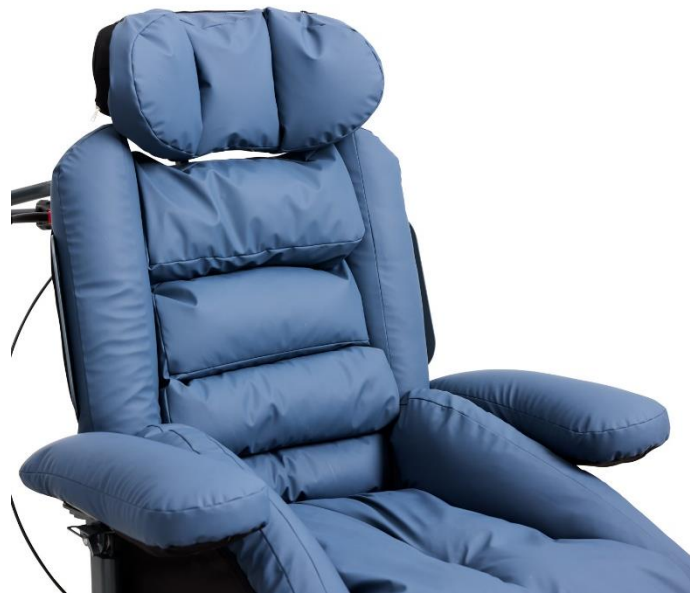
Puderne er modellerbare og kan justeres manuelt til den enkelte borger.

Puderne er nøje udformet til at passe den kropsdel, som de understøtter. Puderne er holdt i en neutral tone, da erfaring viser, at mørke farver kan virke "bundløse" for borgere med visuel-kognitive funktionsproblemer.