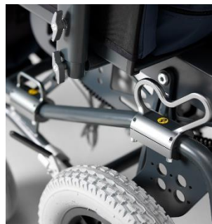
Transit Tie Down beslag (tilkøb)

Eventuelle lokale procedurer omkring rengøring og vedligeholdelse skal altid overholdes.