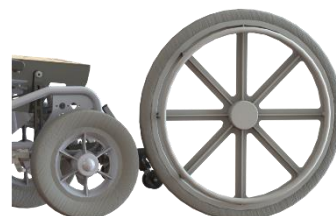
Massive hjul, 12½" (tv) og 24" med drivring (th), i gråt nylon gummi, der ikke efterlader mærker på gulvet.

For mere information om Kamille Power Komfortstol kontakt Cobi Rehab på 7025 2522 eller cobi@cobi.dk .