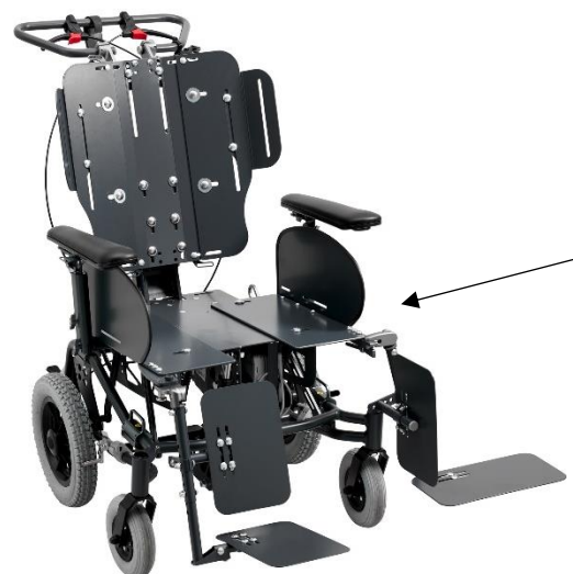
Selvstændige plader i sædesystemet sikrer en præcis indstilling.

Til forskel fra andre komfortkørestole, er størrelsen ikke fast, men et interval. På den måde kan bredde og dybde justeres til bedst muligt at imødekomme brugers dimensioner.