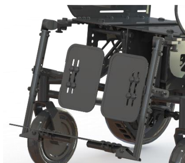
Benstøtterne kan højdejusteres og vinkeljusteres over knæ- og ankelled.

Aftagelige swing away benstøtter kan tilkøbes.