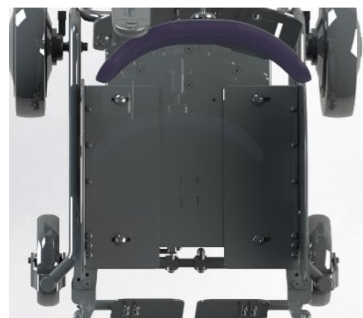
Selvstændige plader i sædesystemet sikrer en præcis indstilling.

Til forskel fra andre komfortkørestole, er størrelsen ikke fast, men et interval. På den måde kan bredde og dybde justeres til bedst muligt at imødekomme brugers dimensioner.