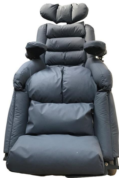
Puderne er modellerbare og kan justeres manuelt til den enkelte borger.

Puderne er nøje udformet til at passe den kropsdel, som de understøtter. Puderne er holdt i en neutral tone, da erfaring viser, at mørke farver kan virke "bundløse" for borgere med visuel-kognitive funktionsproblemer.