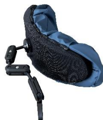
Nakkestøtten består af udskiftelige, kraftige kugleled.

Der er påmonteret to pudeelementer på nakkestøtten, en blød skumbase betrukket med neopren og en blød pude med tre kamre fyldt med Krøyer-kugler og latex skum. De enkelte kamre kan justeres efter behov.