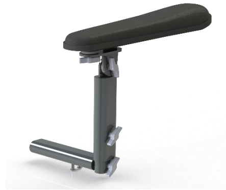
Swing away armlæn er standard på alle udgaver af Kamille Power Komfortkørestol.

Der kan tilkøbes flexarme med tyngde, som understøtter borgers arme og bidrager til yderligere tryghed, ro og komfort.