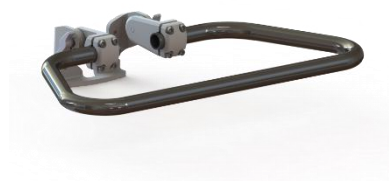
Skubbebøjlen monteres på beslagene, hvor fingerskruerne ses i siderne.

Elektronikken monteret på kørestolen kan ikke forstyrre driften af enheder i kørestolens miljø, som udsender elektromagnetiske felter, fx alarmsystemer i butikker, automatiske døre med mere.