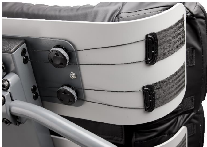
Buede rygplader, der støtter og omfavner brugeren fra bagdel til nakke.

Den modulopbyggede pude kan finjusteres ved hjælp af et patenteret FitGo-system, også kendt fra skistøvler og arbejdssko. FitGo-systemet er placeret på rygpladerne.