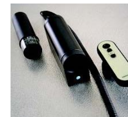
Batteri, styreboks og fjernbetjening.