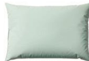
Cobi Stor hovedpude Str. 53x38x12 cm HMI: 101214