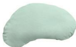
Cobi Finne pude Str. 64x34x8 cm HMI: 101222