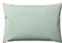
Cobi Lille Hovedpude Str. 39x25x8 cm HMI: 103833