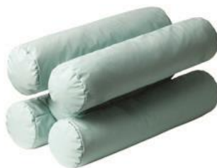
Cobi H-pude Str. 51x30x30 cm HMI: 103835