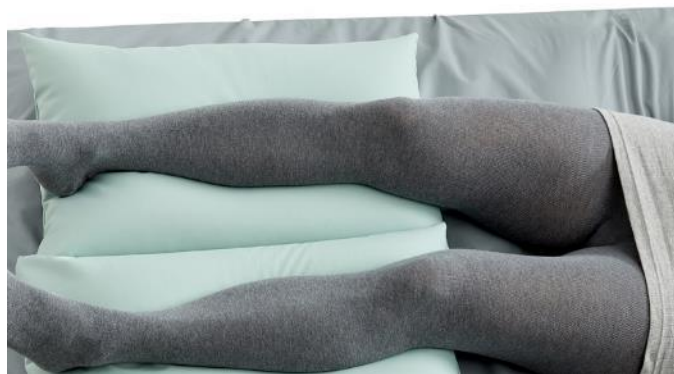
Stor Cobi hovedpude under underben og hæl.