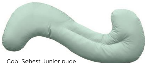
Cobi Søhest Junior pude Str. 127x27x12 cm HMI: 101282