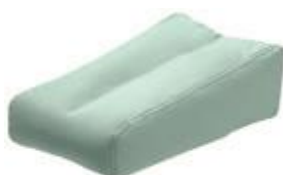
Cobi Hæl/arm pude Str. 40x28x11 cm HMI: 101218