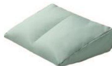
Cobi Kilepude Str. 40x50x14 cm HMI: 103836