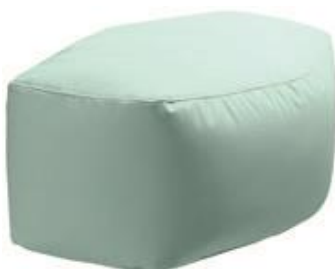
Cobi Universal pude Str. 58x39x22 cm HMI: 101220