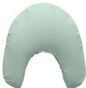
Cobi Skødepude Str. 55x54x12 cm HMI: 101226