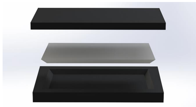
Siddepuden består af tre forskellige slags skum.

Benstøtter kan fjernes uden brug af værktøj og påvirker ikke stabilitet.