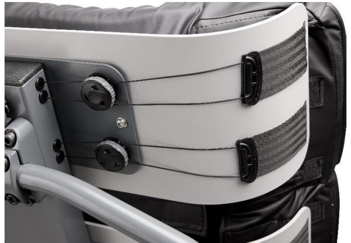
Buede rygplader, der støtter og omfavner brugeren fra bagdel til nakke.

Den modulopbyggede pude kan finjusteres ved hjælp af et patenteret FitGo-system, også kendt fra skistøvler og arbejdssko. FitGo-systemet er placeret på rygpladerne.