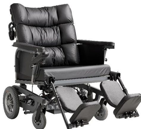
Benstøtter, der kan bære op til 200 kg hver.