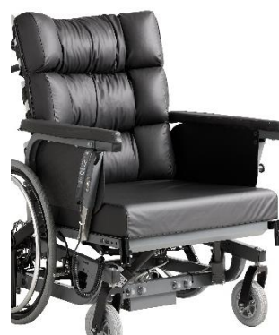
Benstøtterne kan afmonteres uden brug af værktøj.