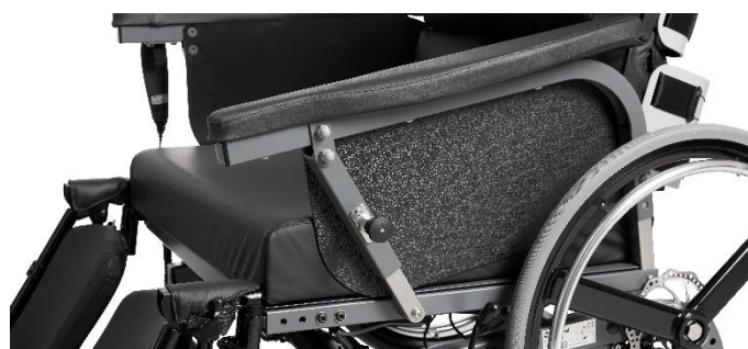
Svingbare armlæn tillader placering tæt på bord.