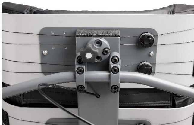
Et universelt nakkestøttebeslag tillader flere typer af nakkestøtter.

Opladeren af mærket EC Buddy fra Swede Electronics har indbygget datalogger, fejlmelding med lyd, et moderne design og er lydløs. Opladeren lader med 12A.