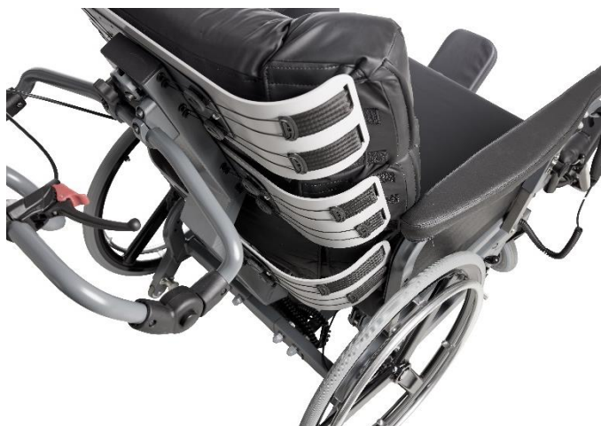
Buede rygplader, der støtter og omfavner brugeren fra bagdel til nakke.

Kørestolens ryg består af et højstyrkestål profil. Profilet er centreret på kørestolens ryg. Vinklingen på profilet gør, at ryggen både støtter den æbleformede og den pæreformede bruger. På profilet er der påmonteret tre rygplader. Rygpladerne er buet for at kunne omfavne og støtte brugeren fra bagdel til nakke.