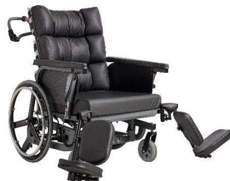
Benstøtter, der kan bære op til 200 kg hver.