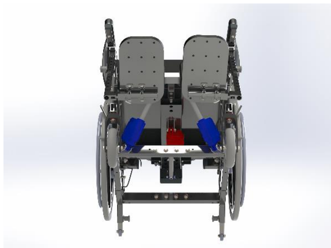
To aktuatorer (markeret med blå) styrer tilt funktionen. Én aktuator (rød) styrer recline.