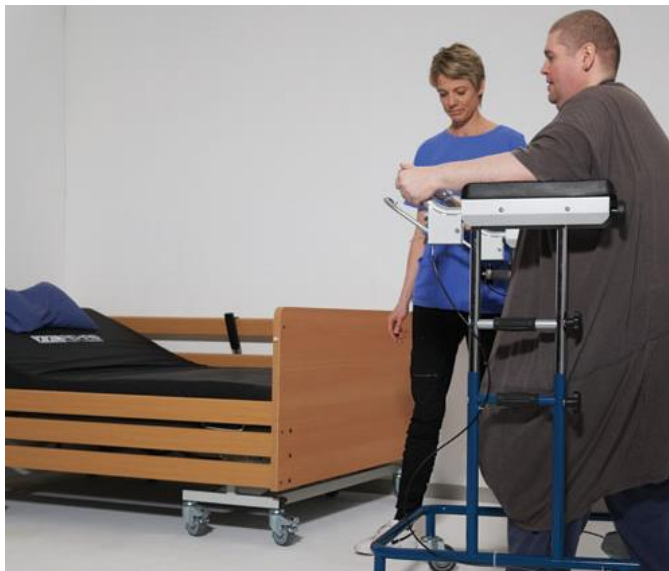
Bariatrisk plejeseng i moderne udtryk, der også passer i private hjem.

Til montering skal der (udover den medfølgende 6 mm unbrakonøgle) bruges en skruetrækker med krydskærv og en skævbidetang.