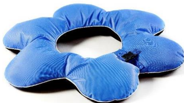
Badeblomst, S Str. 68x20 cm HMI: 72594