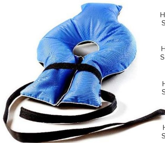
Halsflydekrave, XS Str. 50x34x23 cm HMI: 64990