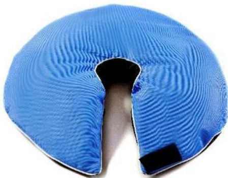
Nakkeflydekrave, S Str. 41x41x26 cm HMI: 70141