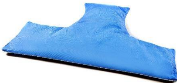
T-formet flydepude, S Str. 63x39 cm HMI: 64984

Størrelser angivet i længde x bredde x halshul