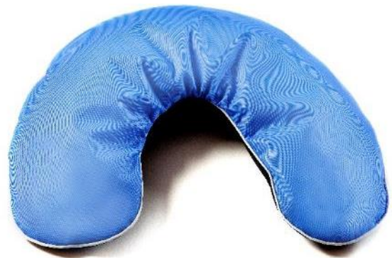
U-formet flydepude Str. 55x19 cm HMI: 64986