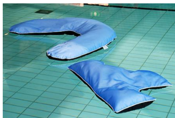
T-formet flydepude og bananformet flydepude.