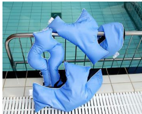
Halsflydekrave, T-formet flydepude og bananformet flydepude.

Vær opmærksom på, at pH-værdien på det anvendte desinficeringsmiddel ikke bør være højere end 11,4.