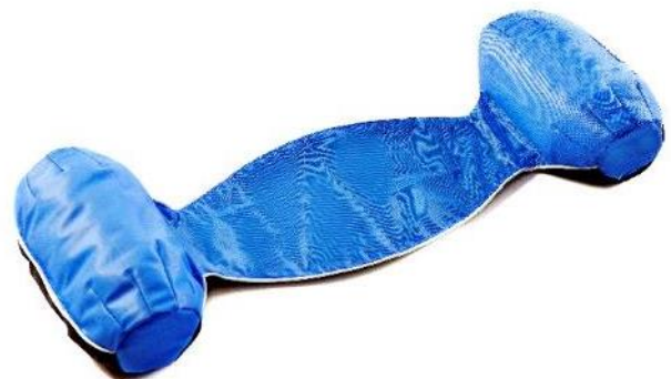
Flydestabilisator, S Str. 60-37x18-25 cm HMI: 72597