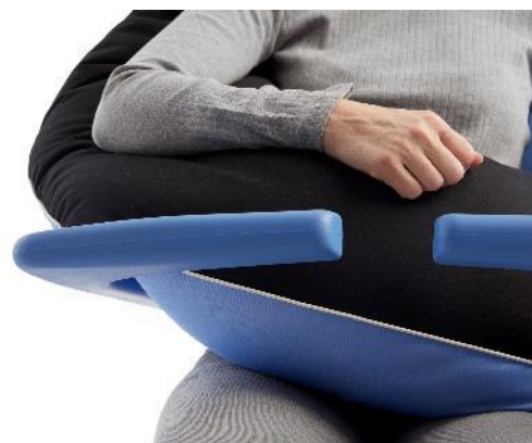
Bananhygiejnepude brugt i badetoiletstol

Når hygiejnepuden skal tørre, hænges den op med den blå netside nedad, så vandet kan løbe ud af hygiejnepuden.