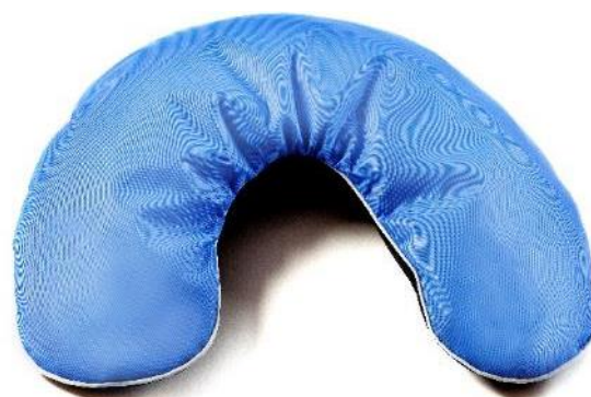
U-formet flydepude Str. 55x19 cm HMI: 64986