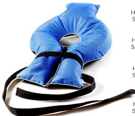
Halsflydekrave, XS Str. 50x34x23 cm HMI: 64990