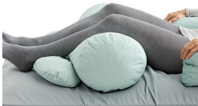
Cobi U-kudde följer överkroppen. Cobi Cylinderkudde under knäna. Cobi Fenkudde under underbenen.

För att desinficera ytan på kudden använd en engångstrasa med etanol (t.ex. Wet Wipe 70 %) eller en klorprodukt 1000-1200 ppm (t.ex. Wet Wipe Chlorine Disinfection).