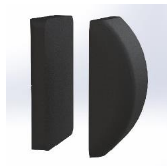
Hvert af de ni moduler i rygpudden består af et hårdt skumlag og et lag med en blanding af Krøyer-kugler og latexskum.