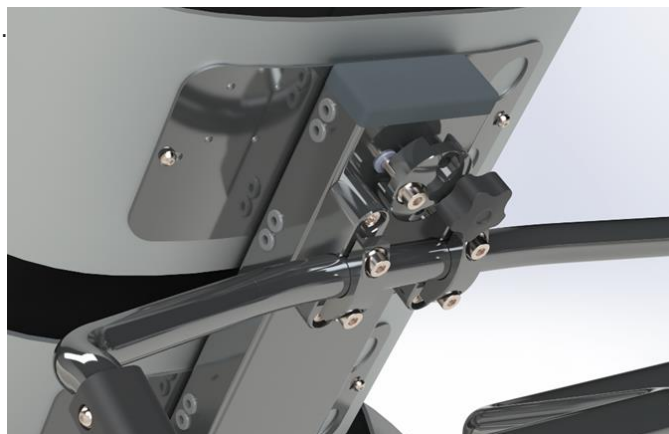
Et universelt nakkestøttebeslag tillader flere typer af nakkestøtter.

Opladeren af mærket EC Buddy fra Swede Electronics har indbygget datalogger, fejlmelding med lyd, et moderne design og er lydløs. Opladeren lader med 12A.