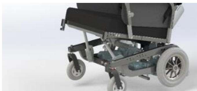
Benstøtterne kan afmonteres uden brug af værktøj.