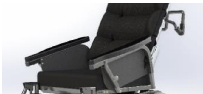
Svingbare armlæn tillader placering tæt på bord.