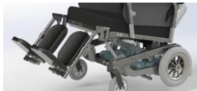
Benstøtter, der kan bære op til 200 kg hver.