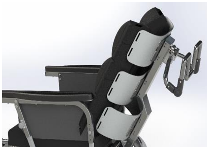
Buede rygplader, der støtter og omfavner brugeren fra bagdel til nakke.

Kørestolens ryg består af et højstyrkestål profil. Profilet er centreret på kørestolens ryg. Vinklingen på profilet gør, at ryggen både støtter den æbleformede og den pæreformede bruger. På profilet er der påmonteret tre rygplader. Rygpladerne er buede for at kunne omfavne og støtte brugeren fra bagdel til nakke.