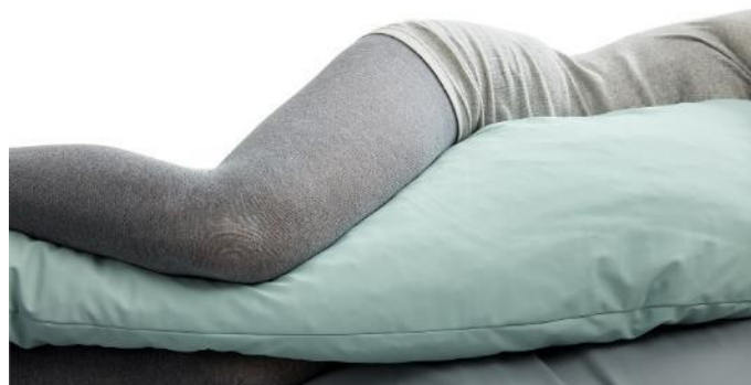
Cobi Flexi pude langs forsiden af kroppen.

eller et klorprodukt 1000-1200 ppm (fx Wet Wipe Chlorine Desinfection).