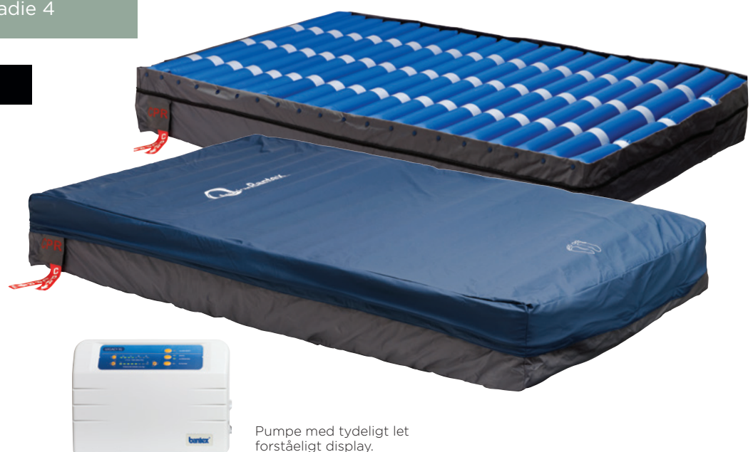
Pumpe med tydeligt let forståeligt display.