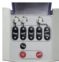
Betjeningspanel for plejepersonalet