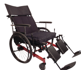
30° hydraulisk nedfældbar ryg