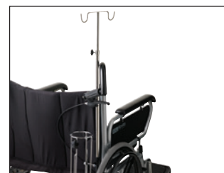
Ittflaskeholder med dropstativ