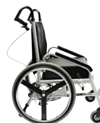
Sports armlæn set fra siden