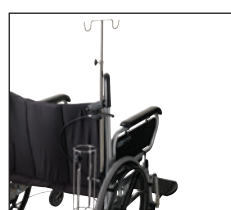
Ittflaskeholder med dropstativ