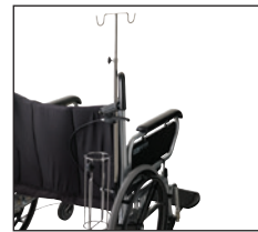
Iltflaskeholder med dropstativ